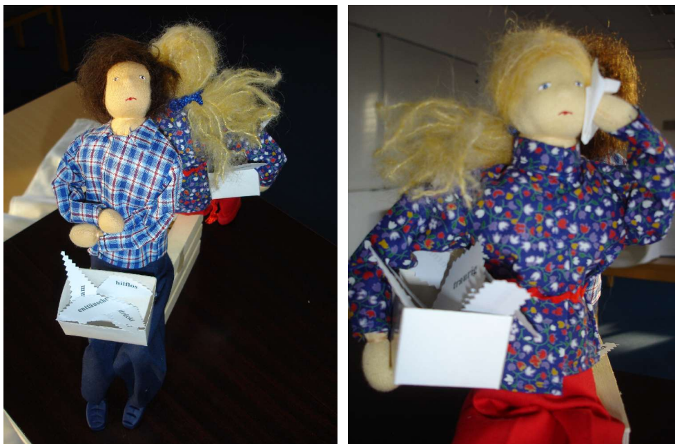
Ein Paar im Streit: er fühlt sich hilflos und enttäuscht, sie traurig und deprimiert der Kontakt zu den Bedürfnissen ist unterbrochen, keine Lösung in Sicht

Hilfreicher ist es, wenn ich denselben Vorwurf mit Ohren des Mitgefühls hören kann. Dann wende ich mich zunächst dem zu, was sich in mir abspielt: „Ich bin unzufrieden, weil ich Respekt brauche, und ich bin sauer, weil ich mit meiner Anstrengung gesehen werden möchte, Klarheit in den Stoff der Besprechung gebracht zu haben!“ Sobald ich mit dem „richtigen“ Bedürfnis in Kontakt bin, spüre ich körperliche Entspannung und kann nun nach Wegen schauen, um respektiert und mit meinen Anstrengungen gesehen zu werden. Danach kann ich mein Einfühlungsvermögen meinem Gesprächspartner zuwenden um herauszufinden, was in ihm vorgeht. „Sind sie unzufrieden, weil Sie auf andere Art und Weise unterstützt werden möchten und weil Ihnen die vollständige Einbeziehung aller angesprochenen Punkte wichtig ist?“ und dann überprüfe ich das. Die Einfühlung für mich, gibt mir Kraft, mich für meine eigenen Bedürfnisse einzusetzen, die Einfühlung für meinen Vorgesetzten, erlaubt mir, mich mit seinen Bedürfnissen zu verbinden und in ihm den Mitmenschen zu sehen.