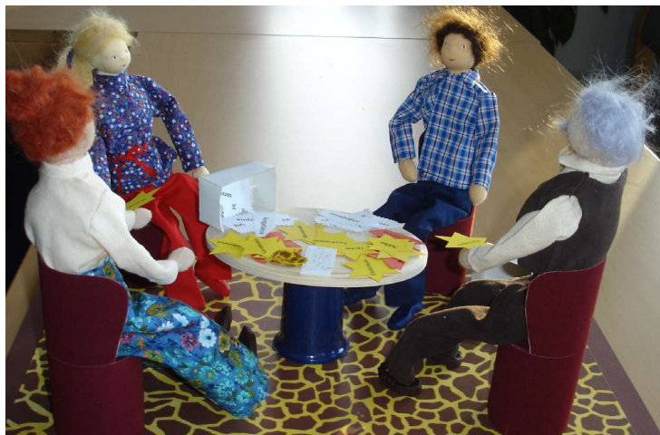
Im Mediationsgespräch: was zu klären ist, kommt auf den Tisch Die Gefühle weisen den Weg zu den unerfüllten Bedürfnissen

Gerade auch aus buddhistischer Sicht empfiehlt sich ein Vorgehen in der Mediation, das mitfühlende Verbindung und gegenseitiges Verstehen fördert. Hilfreich ist die Fähigkeit, hinter der gewaltvollen Ausdrucksweise die Not und den Schmerz der Beteiligten zu erkennen, weil wichtige Bedürfnisse sich im Mangel befinden.