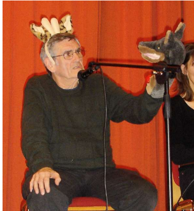
Rosenberg mit Giraffenohren und Wolfspuppe

Recht zu bekommen. Diese Sprache ist geprägt von Konkurrenz, Dominanz und Gewalt. Marshall Rosenberg, der Begründer der „Gewaltfreien Kommunikation“ (GFK) nennt sie „Wolfsprache“. Die Sprache der Verständigung, die er lehrt, heißt bei ihm „Giraffensprache“. Wolfs- und Giraffenhandpuppen helfen ihm dabei, die Sprachunterschiede auf einfache Art zu verdeutlichen.