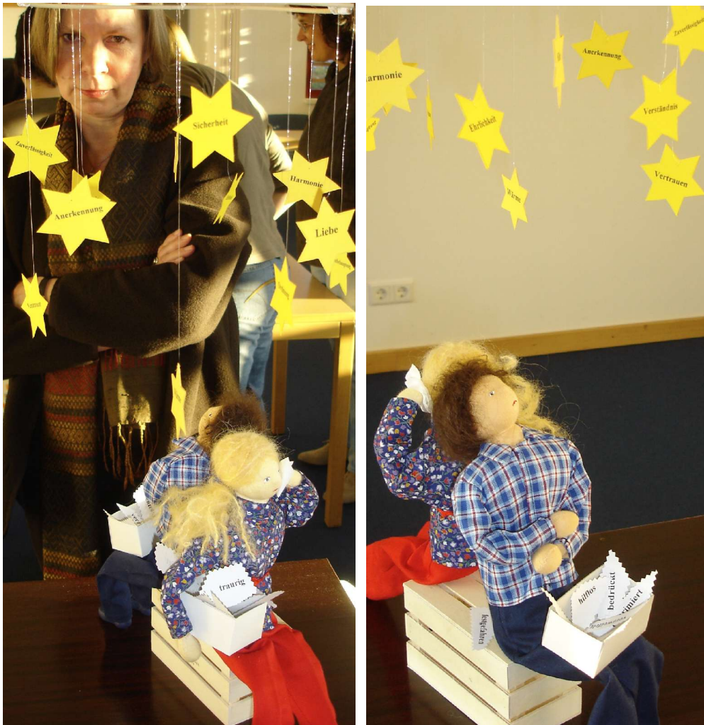
Eine dritte Person kann oft sehen, was die Parteien brauchen: Liebe, Anerkennung, Harmonie, Zuverlässigkeit, Vertrauen, Kontakt - Bedürfnisse, die ihnen fern wie Sterne erscheinen

unterstützen ein konstruktives Ergebnis zu erreichen. Das ist das Angebot der Mediation. Denn Mediation ist die Kunst, im Konflikt so zur Verständigung beizutragen, dass Lösungen gefunden werden, mit denen alle Beteiligten zufrieden sind.