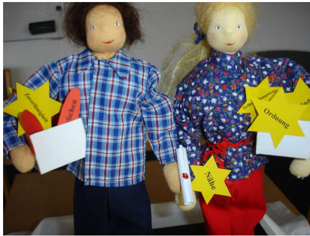
Glücklich und zufrieden verlässt das Paar die Mediation, im Kontakt mit seinen Bedürfnissen und einer Vereinbarung, die deren Erfüllung unterstützt.

hervorgebracht werden wie Ärger – der Gedanke ist, „der andere ist verkehrt!“, Schuld - „ich bin verkehrt“, Scham – „die anderen denken bestimmt, ich bin verkehrt!“ werden zurückgeführt auf die hinter diesen Gedanken stehenden unerfüllten Bedürfnisse.