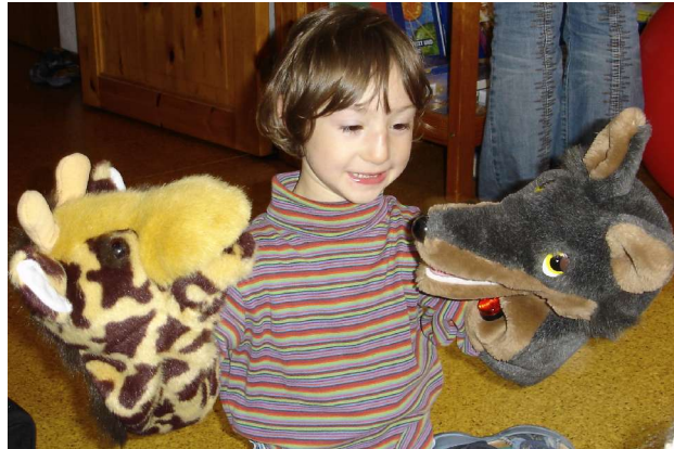
Auch Kinder verstehen den Unterschied von Wolfs- und Giraffensprache