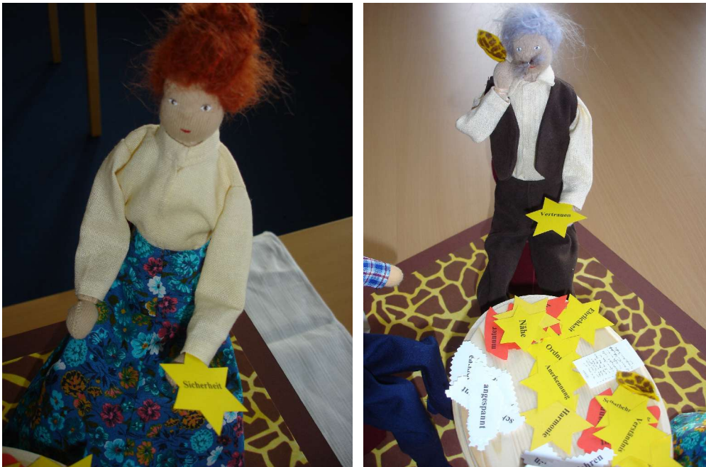
Die Mediatorin wertet auf und gibt Sicherheit, der Mediator hört mit einem besonderen Ohr: er hört die Bedürfnisse heraus hinter Vorwürfen und Anschuldigungen und übersetzt Verurteilungen

Als der Frau das klageworden war, nahm sie Kontakt auf zu ihrem Mann, um ihm davon zu berichten. Der Mann war von ihrer Entscheidung völlig überrascht gewesen. Er hatte mit seinem Verhalten etwas für sein Bedürfnis nach Entspannung tun wollen. An seine Frau hatte er noch gar nicht gedacht. Als er hörte, was sie brauchte, war er gern bereit, dazu beizutragen, diese Bedürfnisse zu erfüllen. Sie zogen danach wieder zusammen.